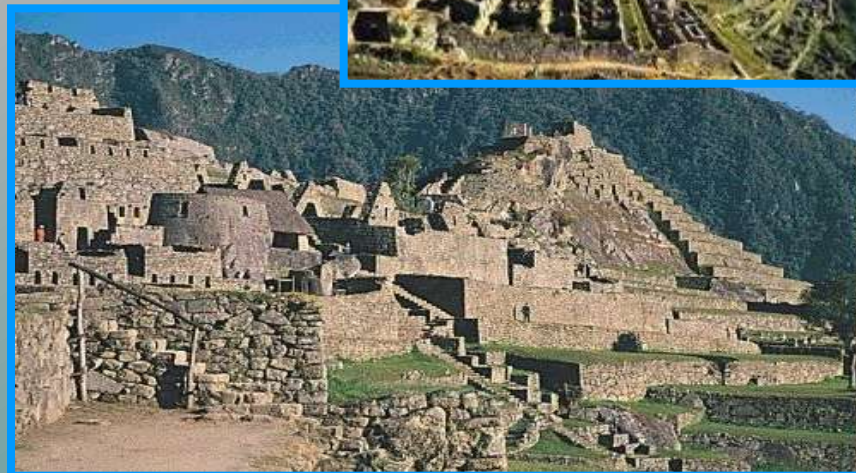
Machu Picchu-mesto Inkov